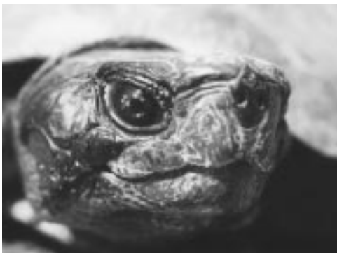
Tortue des bois A. Thibault