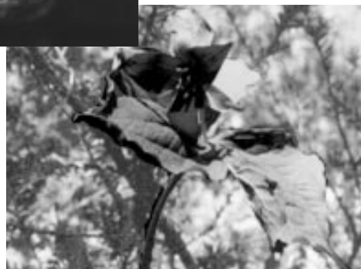
Trille dressé A. Thibault