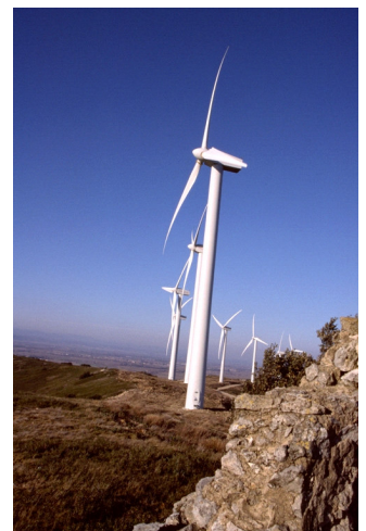
Les éoliennes : source d'énergie renouvelable