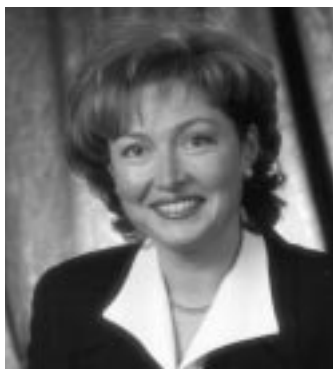
Linda Goupil Députée de Lévis

La générosité, la force de caractère et la fierté qui habitent les femmes et les hommes de notre beau coin de pays, combinées à la richesse des ressources naturelles, la variété des espèces animales et la beauté des paysages font de Chaudière-Appalaches, une région où il fait bon vivre.