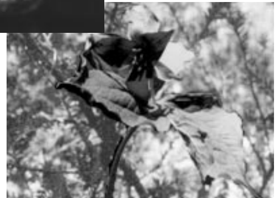
Trille dressé A. Thibault